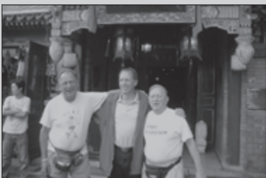
Zig-zag door Beijing 25