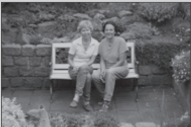
Gezusterlijk wandelen in Rooi 16-17