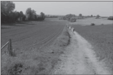
Ronde van Zuid-Limburg 20-22